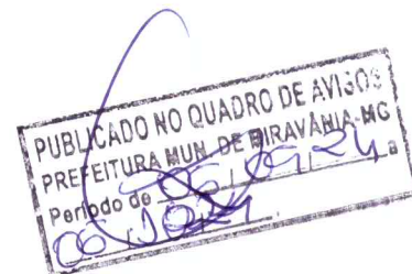
Elzio Mota Dourado Prefeito Municipal de Miravânia